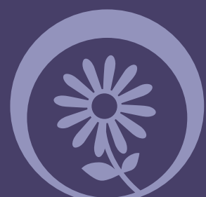
Extrato de Camomila

A Espuma de Limpeza Iron Skin Care é composta por Extratos Naturais, Glicerina e livre de Sulfato proporcionando uma limpeza suave e maior maciez na pele. Em sua fórmula o uso de Extratos Naturais como: Extrato de Camomila, Extrato de Sálvia, Extrato de Chá Verde e Extrato de Centella Asiática, proporcionam uma maior limpeza sem irritar a pele para os procedimentos de tatuagem e micropigmentação.