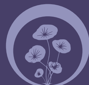
Extrato de Centella Asiática