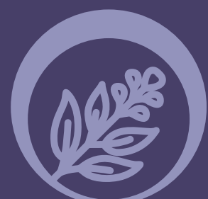
Extrato de Sálvia