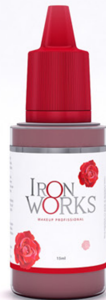
28 - Iluminador

PIGMENTOS COLORIDOS EXCLUSIVO PARA USO PROFISSIONAL MAKE UP Atenção: Os pigmentos descritos nessa tabela, são de uso profissional. A responsabilidade do manuseio, técnica de aplicação e respectivo resultado, são de responsabilidade do profissional.